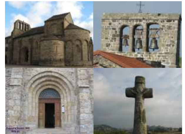
du ciel aux différentes heures du jour . . . , rencontres . . . , amitié . . . , ouverture aux autres . . . , à l'Autre . . . ,