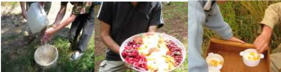
partage des tâches. . . , des repas . . . ,