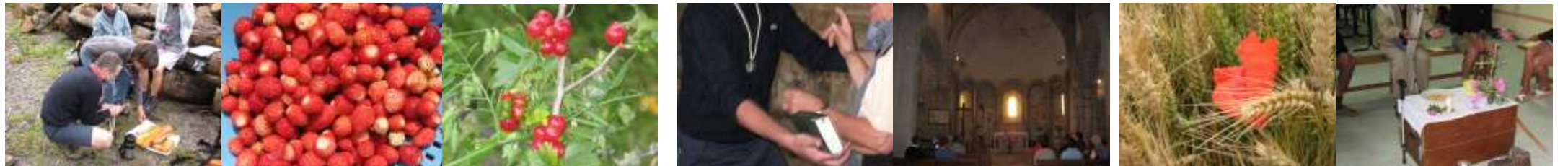
pauses casse-croûte, délices de la nature . . . , temps d'échanges, de prières . . . , célébrations . . . ,