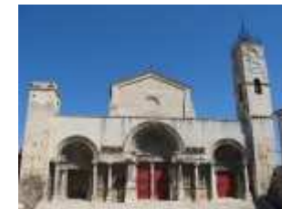
. . . vers St Gilles !