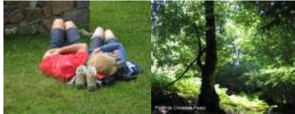
siestes . . . , beauté de la nature . . . , des lieux traversés ,