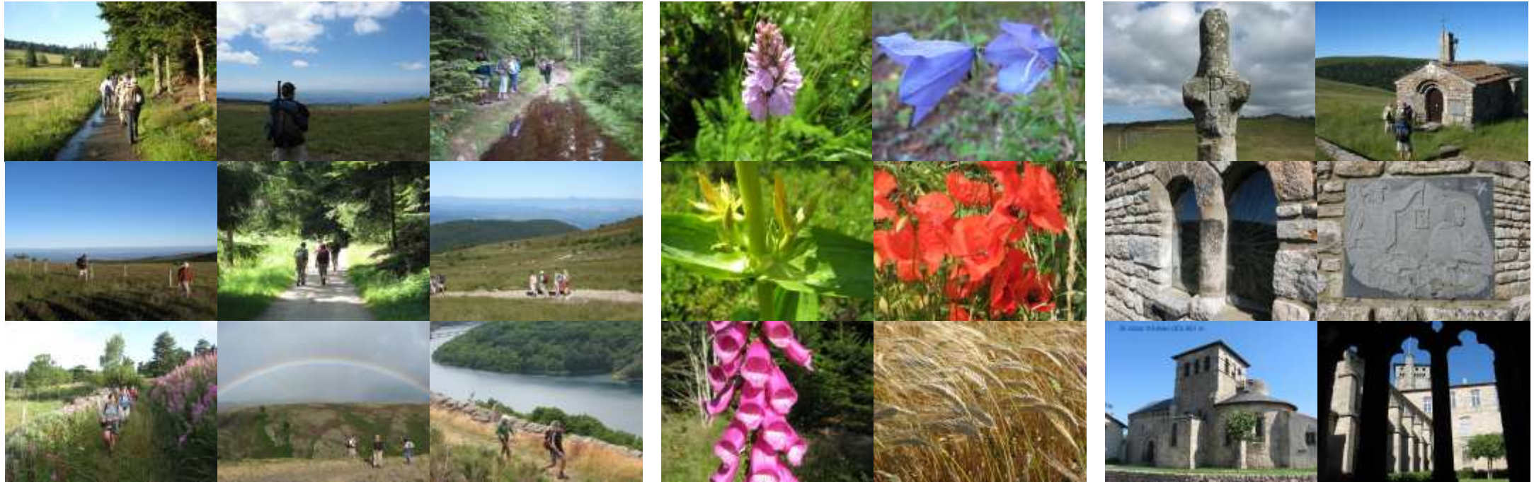
Marches conviviales . . . , paysages variés . . . ,